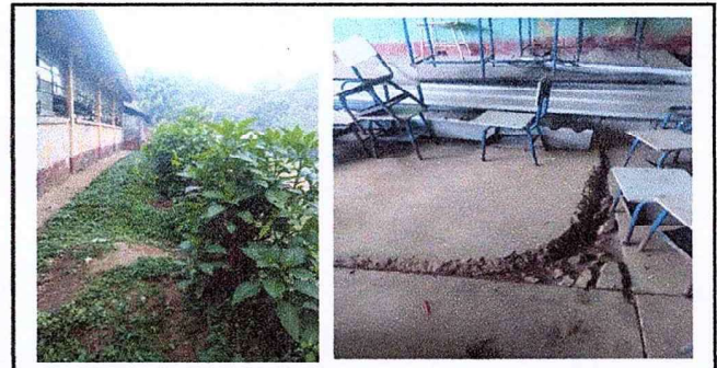
Sustitucion de vidrios y mantenimiento de balcones, asi tambien sustitucion de piso de concreto en el aula.

Observación: Si es necesario se pueden agregar hojas adicionales y actualizar el número de hojas.