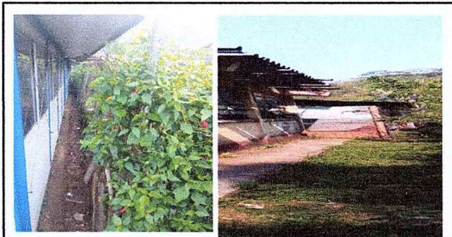
Sustitucion de cerco y muro perimetral, mejoramiento de servicio sanitario.