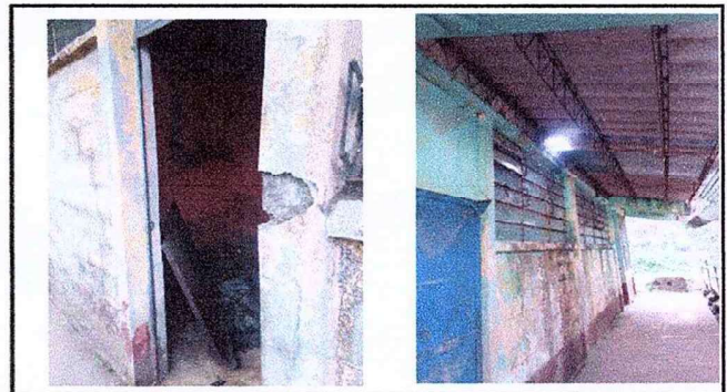
Sustitucion de puertas y mejoramiento en paredes que se pintaran de azul y celeste nacional externo e interno.