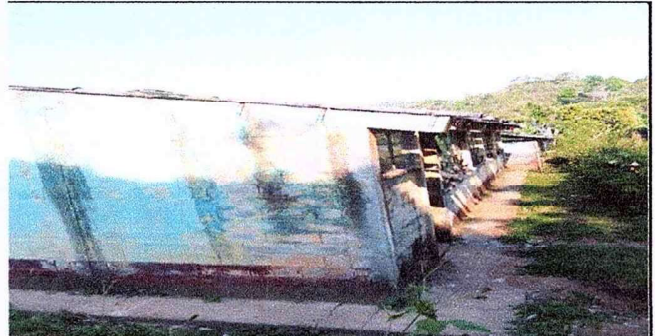
Parte frontal de paredes en malas condiciones deteriorado, se necesita remozar.