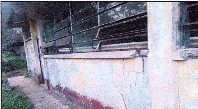
Mejoramiento de paredes en las instalaciones de los diferentes modulos , se observa que esta muy deteriorado ,